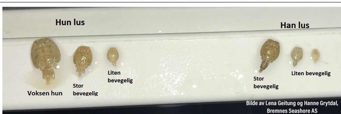
Bilde 1: Oversikt over bevegelege og kjønnsmodne stadier.